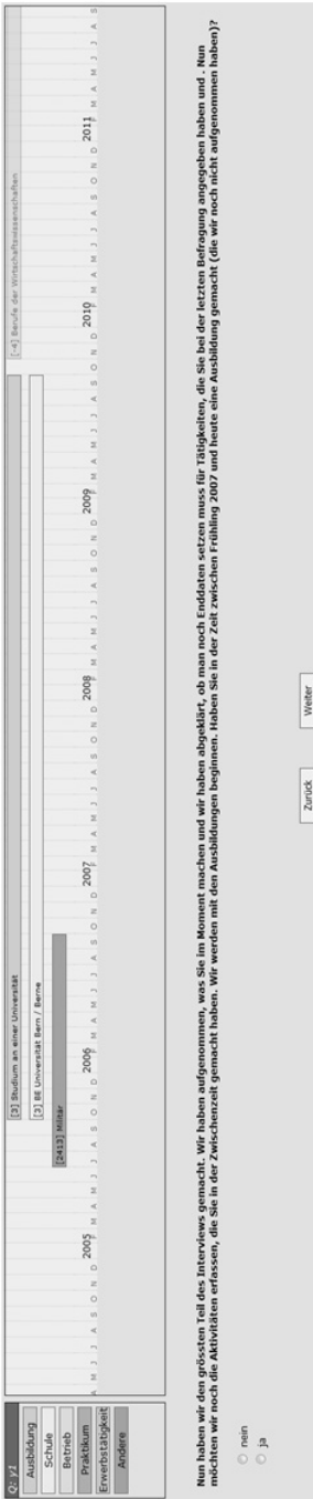
Abbildung eines Original-Screenshots